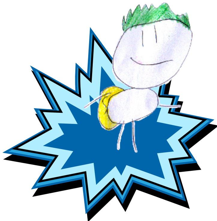
Supermasa, yhdenvertaisuuden supersankari (tehtävä s. 3) Piirtänyt Matias S.

Tehtäviä ja harjoituksia alle kouluikäisille