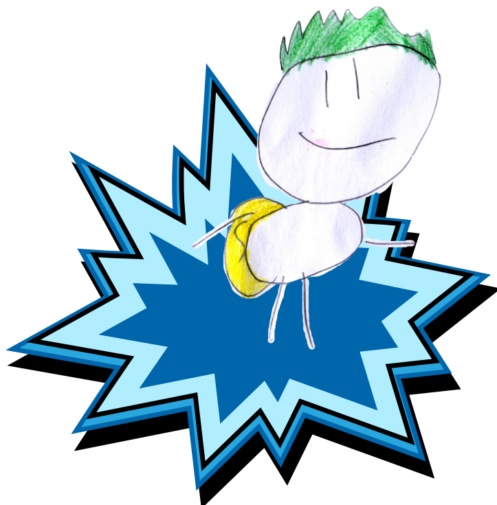
Supermasa, yhdenvertaisuuden supersankari (tehtävä s. 3) Piirtänyt Matias S.

Tehtäviä ja harjoituksia alle kouluikäisille